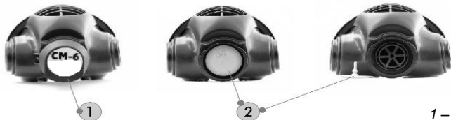
1 – krytka vydechovací komory 2 – vydechovací ventil